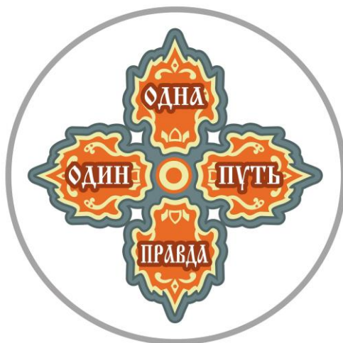
Печать - Символ Идеологии Правды